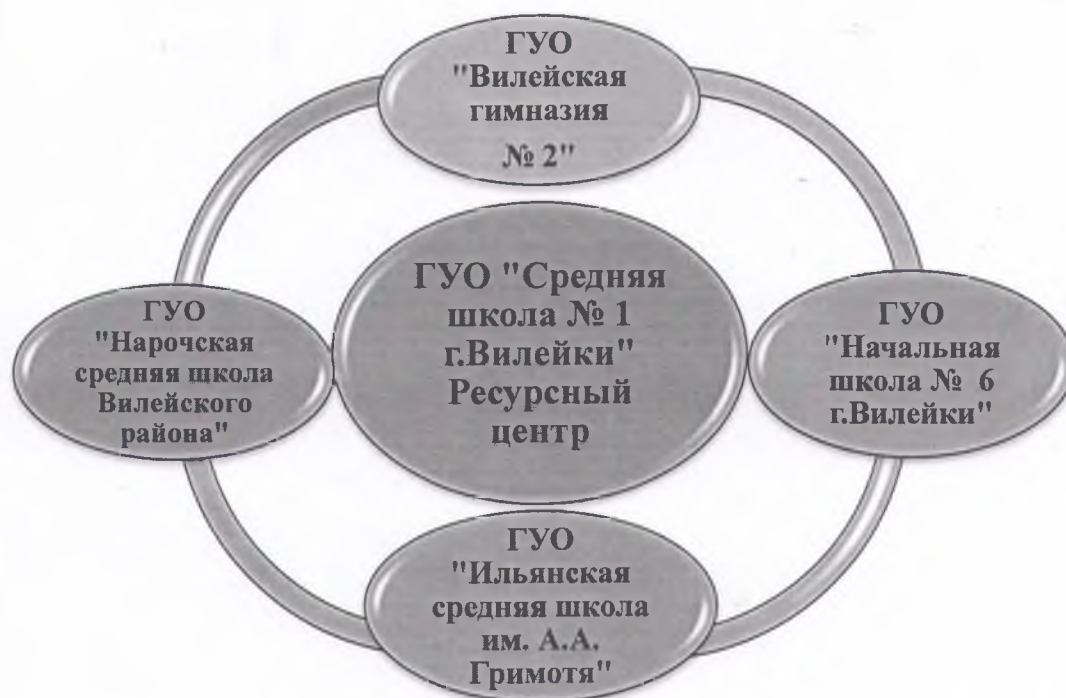
Рисунок 4. Модель реализации проекта в условиях Вилейского района в 2019 году